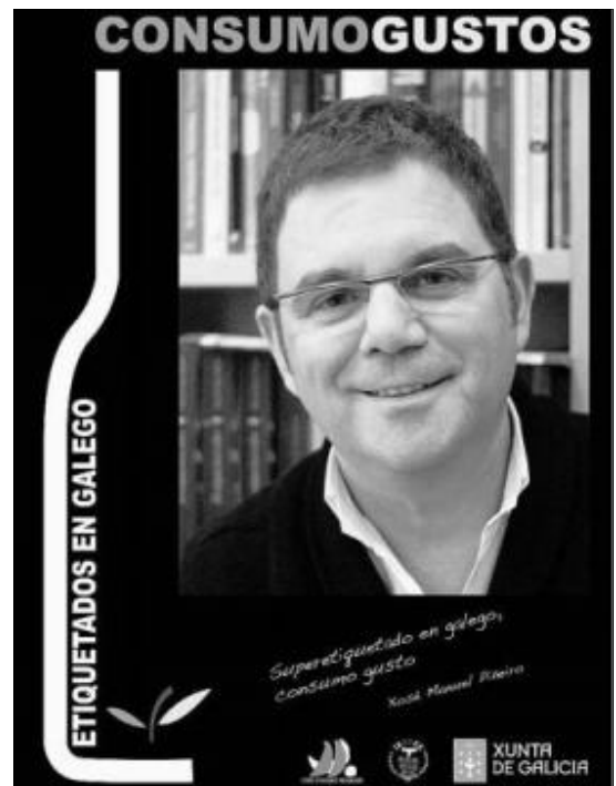
O presentador Xosé Manuel Piñeiro.