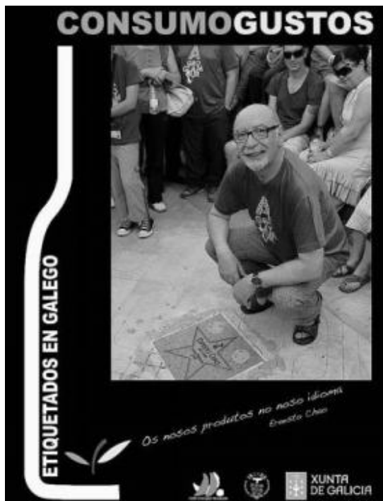
O actor Ernesto Chao.